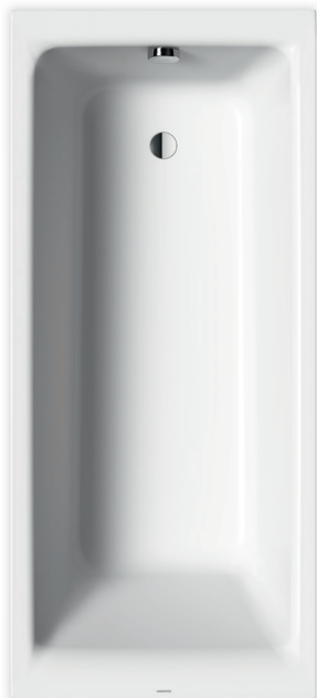
La foto puede variar del producto original